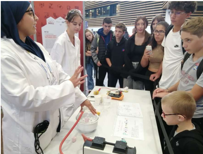
Cours de physique dans les allées d'Eurexpo à Lyon