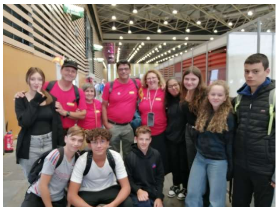
Nos élèves avec la délégation espagnole à Lyon.